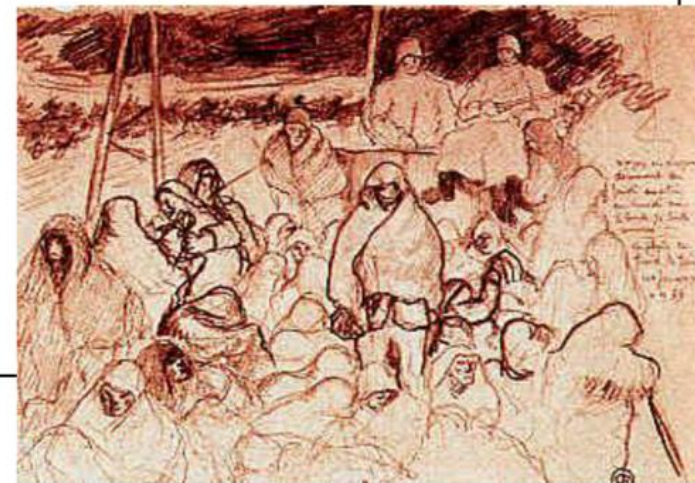
Évacuation du camp de Dora, dessin de Léon Delarbre (convoi entre Dora et Bergen-Belsen qui a erré 5 jours)

22 mai : arrivée en France au centre de rapatriement de Valenciennes 23 mai : arrivée à l'hôtel Lutetia 25 mai : arrivée à la gare de Quimper